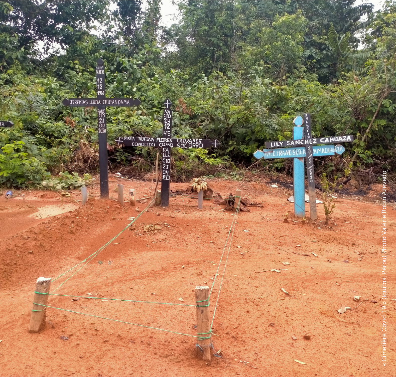
« Cimetière Covid-19 » (Iquitos, Pérou)